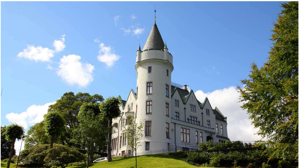
Самостоятельный ужин. Ночь в отеле Бергена.